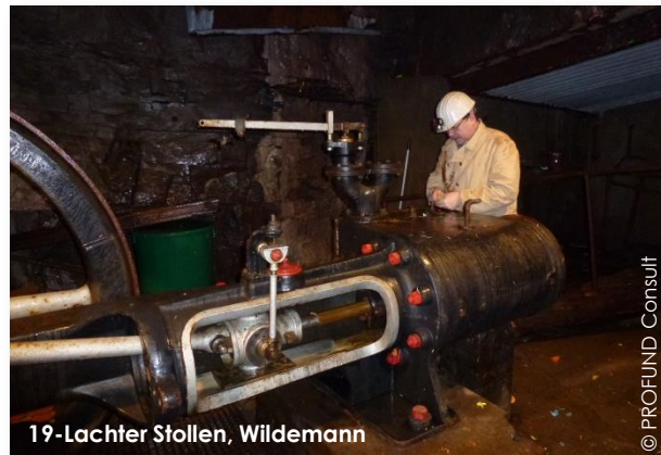
19-Lachter Stollen, Wildemann

Darüber hinaus gibt es in der Region eine Vielzahl authentischer Orte (Stollen, Schächte, Fördertürme), die als Bergbaumuseen u.a. von Fördervereinen betreut werden.