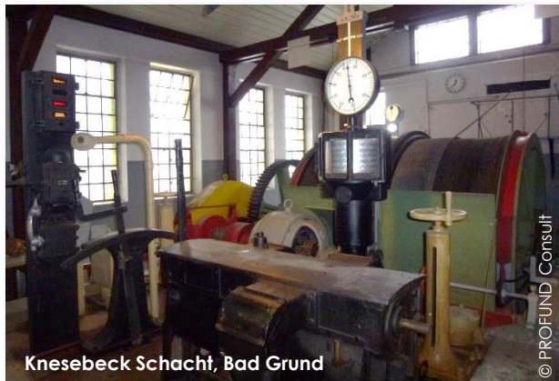
Knesebeck Schacht, Bad Grund

Das seit 1992 bestehende UNESCO-Welterbe „Erzbergwerk Rammelsberg & Altstadt von Goslar“ wurde 2010, um das System der „Oberharzer Wasserwirtschaft“ erweitert. Seitdem erstreckt sich der Wirkungsraum auf eine Fläche von 220 km 2 .